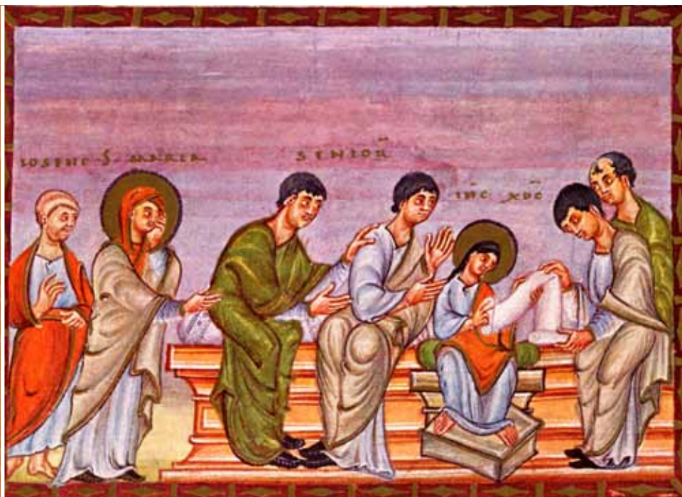
Jésus au milieu des docteurs – Evangélaire d'Egbert.

Marie est pensive. Ses mains et celles de deux docteurs de la Loi forment une chaîne pour désigner Jésus qui donne aux Ecritures son sens plénier.