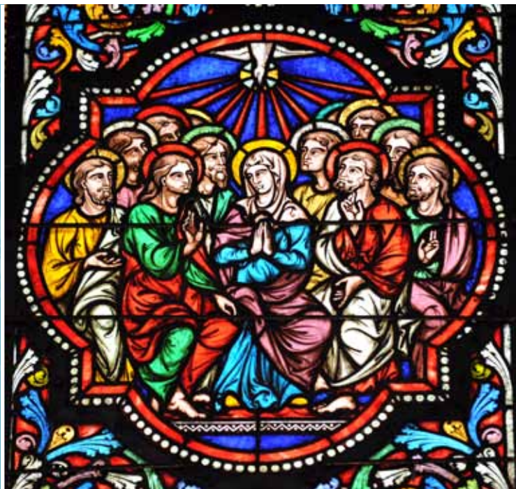
La Pentecôte – vitrail cathédrale Notre-Dame de la Treille, Lille.

Au centre du cénacle, Marie, en prière, le regard tourné vers saint Jean, personnifie l'Eglise.