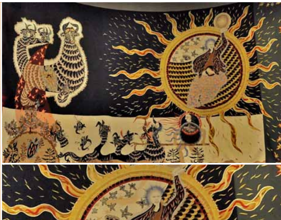
Lurçat, Apocalypse (détail) , plateau d'Assy (Haute-Savoie).

Sur un fond de nuit, la femme et le dragon s'affrontent en un duel décisif. Selon la vision de saint Jean, cette femme c'est l'Eglise en butte à la puissance destructrice du mal. Mais c'est aussi la Vierge Marie, dont le triomphe est illustré dans la partie inférieure de la tapisserie, par l'écrasement tumultueux du dragon.