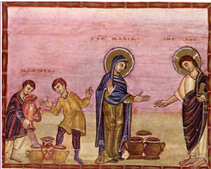
Les noces de Cana , évangélaire d'Egbert, Trèves.

Marie est ici à la jonction de la première alliance représentée par les serviteurs autour des jarres de purification et la nouvelle alliance. A sa demande, le vin nouveau va couler à flots.