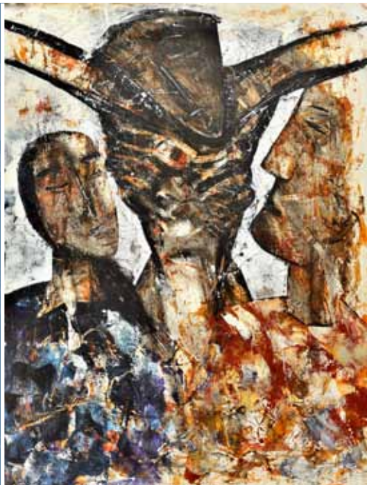
Marie au pied de la croix. Jean-Luc Bonduau – Cathédrale Notre-Dame de la Treille, Lille.

Marie se tient près de son Fils, lui la source de la vie. Les visages sont sereins. Tout est accompli.