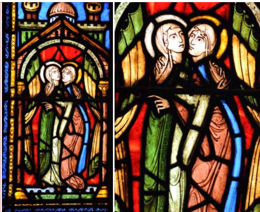
Visitation, Basilique Saint-Denis