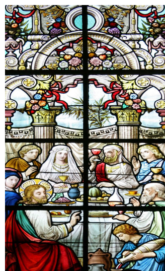
Noces de Cana. Bollezeele

La-Nativité-de-Notre-Dame (LA CRECHE) Immaculée Conception (STEENT'JE) Notre-Dame des Sept Douleurs (LA CROIX-DU-BAC) Notre-Dame de Lourdes (HAZEBROUCK) Assomption de Notre-Dame (RENESCURE) Notre-Dame Auxiliatrice (LE SART) Assomption de Notre-Dame (LE DOULIEU)