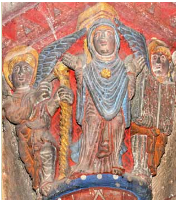
L'annonciation , chapiteau d'Issoire (Puy-de-Dôme)

Marie et deux anges face à nous, dans ce petit espace. L'un porte la Parole, l'autre le bâton du messager. Marie est toute ouverture : «Parle, Seigneur, ta servante écoute».