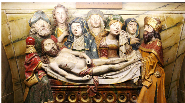
Mise au tombeau Wylder

Notre-Dame de Lourdes Notre-Dame Czestochowa